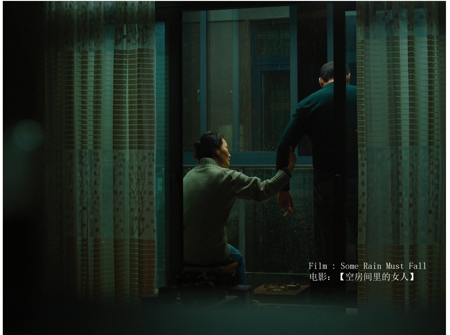
Film: Some Rain Must Fall 电影：【空房间里的女人】

邱阳：最简单的答案是，我的电影总是关于人物探索。这是我通过这些角色探索人性的复杂性和脆弱性的机会，而我还没有真正找到一个我有兴趣探索的男性角色。