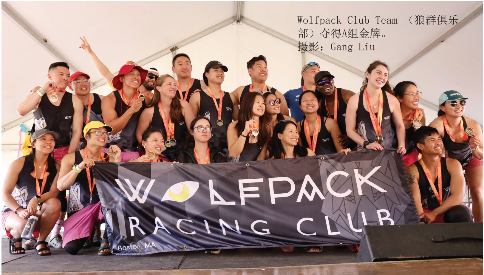
Wolfpack Club Team（狼群俱乐部）夺得A组金牌。

6月9日，第45届波士顿香港龙舟节在剑桥查尔斯河举行，共有68支龙舟队参赛。龙舟节为家庭和参与者提供了一系列活动，包括传统亚洲舞蹈、武术表演和现场古典中国音乐等文化表演。游客还可以享受艺术和手工艺品区和各种食品摊位，以满足他们全天的游玩。这是一个难得在观看激动人心的龙舟比赛的同时，也可体验丰富文化的活动。今年，Wolfpack Club Team（狼群俱乐部）夺得了A组的金牌。