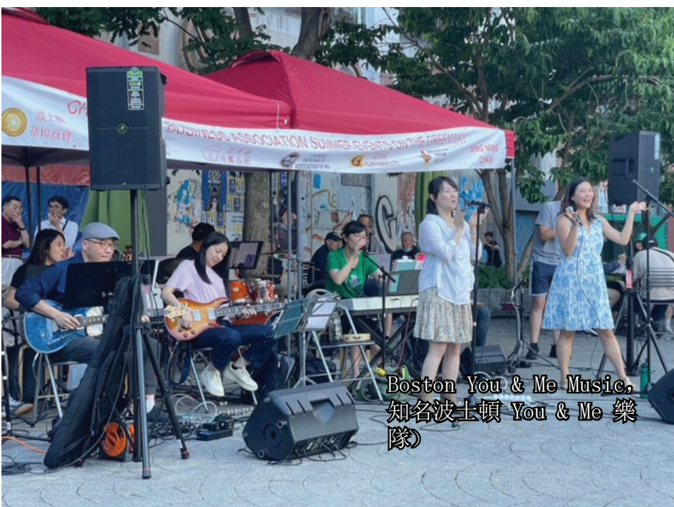
Boston You & Me Music, 知名波士頓 You & Me 樂隊