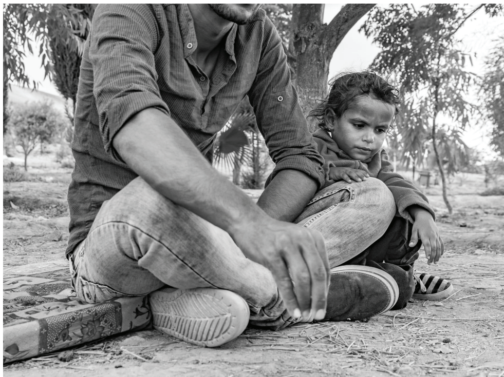
纳卡布/内盖夫沙漠的 Al Rayshayda 贝都因人家庭

Skip Schiel：你很好地描述了一个方面：让故事更人性化，这样人们就可以直接看到我所说的“纳克巴”幸存者的面孔和家园。但同时也可以看到他们原来的家园。我有黑白肖像和风景，或者我称之为“现场照片”，颜色很奇怪。人们称之为棕褐色，但我称之为雾蒙蒙的云雾。我采访和拍照，我了解他们来自哪里。他们来自现在在以色列的大多数地方，这些地方对他们来说都无法到达。因此，我有特权，我的护照，我的国籍，我可以去那里的任何地方。我可以成为他们的代理人，我可以回到他们原来的村庄，回到他们原来的城镇，回到他们的农村地区——如果我能找到它——我可以拍摄它。我不能只拍摄废墟或空地，或以色列定居点，我必须找到一些指向的东西，表明以前阿拉伯人或巴勒斯坦人的居住地，比如一座被毁坏的清