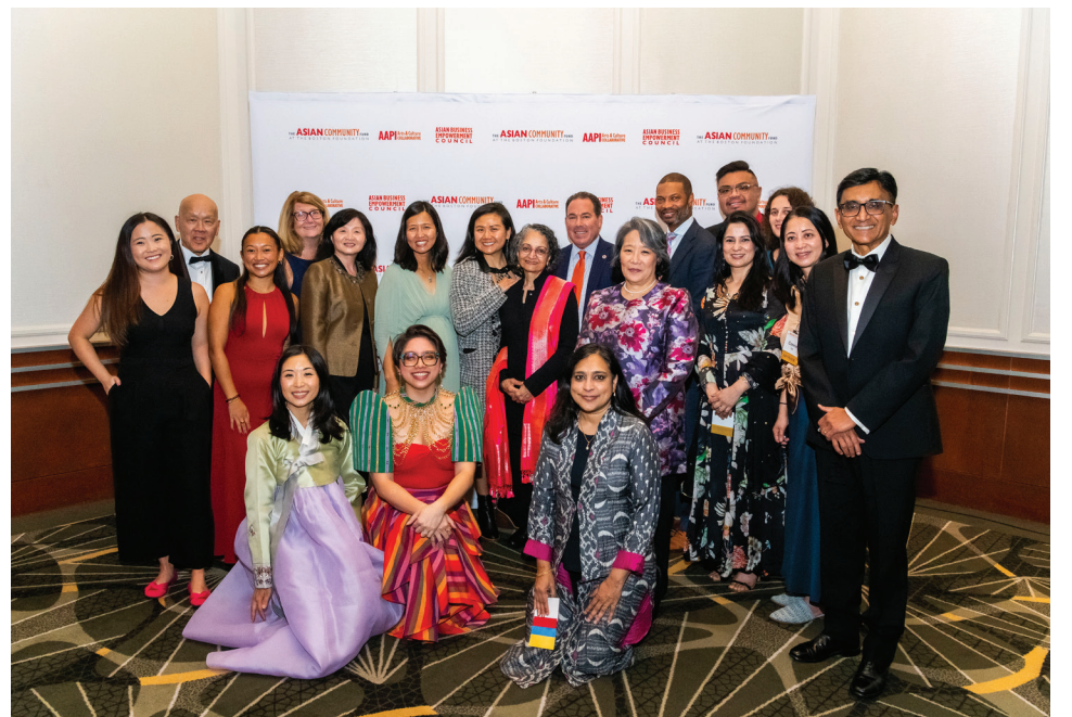
The Asian Community Fund leadership and staff, Gala Co-Chairs, steering committee, partners, and honorees together at the Asian Community Fund's Inaugural Gala

Asian Community Fund于2024年10月3日在波士顿The Westin Copley Place成功举办了首次盛大晚会。该活动汇集了来自马萨诸塞州的亚裔领袖及盟友，共同庆祝本地区最杰出亚裔人士的成就，推动亚裔的可见性、代表性及叙事变革。这是一个令人难忘的夜晚，加强了社区联系并扩大了变革的声音。